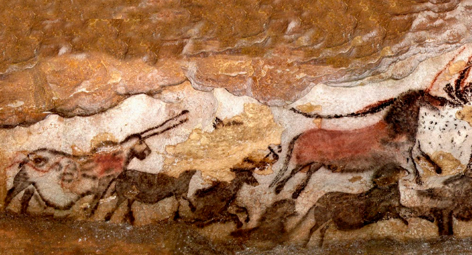
Prizor iz Rotunde ili Dvorane bikova, Lascaux, Francuska, 17000 g. pr. Kr.

Špilje poput Lascauxa oslikavale su tri generacije umjetnika. Na nekim mjestima na tlu pronađeni su slojevi pločica s više ili manje uspelim "studijama". Vjerojatno je postojalo nešto što bismo mogli nazvati "umjetničke škole", jer je nesumnjivo postojao određeni način podučavanja i prenošenja vještine. Zbog oštećenja oslikanih zidova uzrokovanih otvorenosti špilja, osvjetljenjem, prolaskom velikog broja ljudi i mikrobiološkim onečišćenjem, danas je većina špilja zatvorena za javnost. Izrađene replike predstavljaju dobar primjer zaštite spomenika kulture, ali i veliku mogućnost za istraživanje.